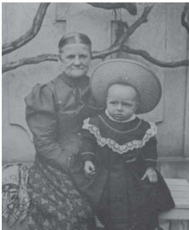
S babičkou v roce 1908