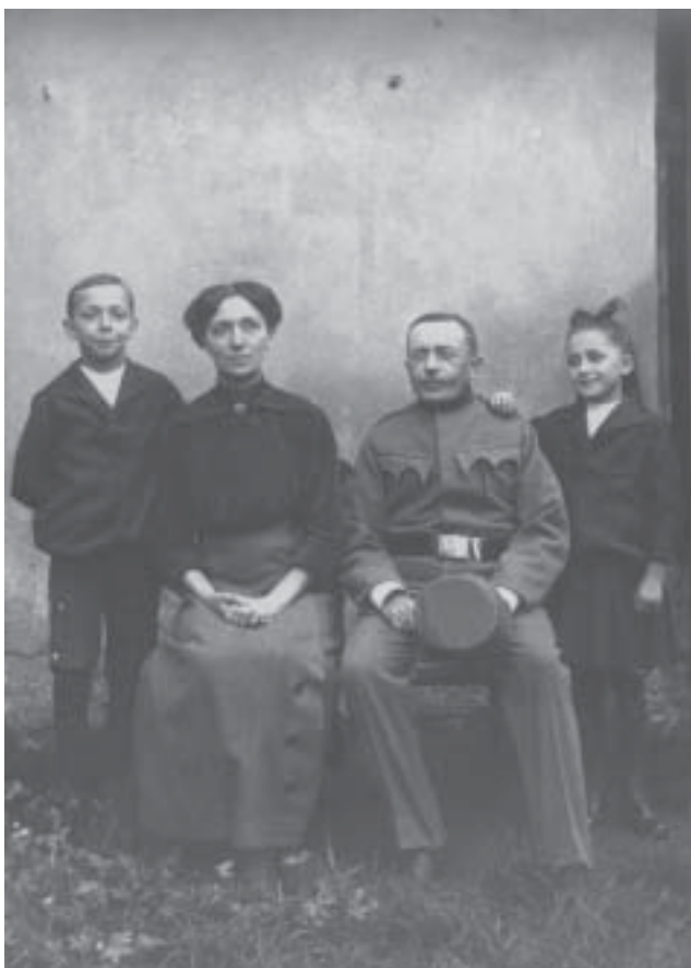
Rodiče a děti