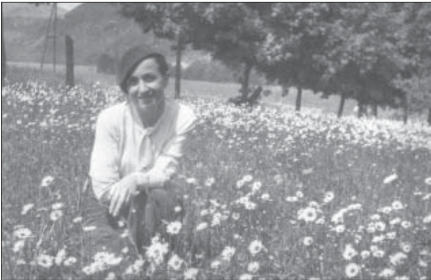
Budoucí paní Niklová