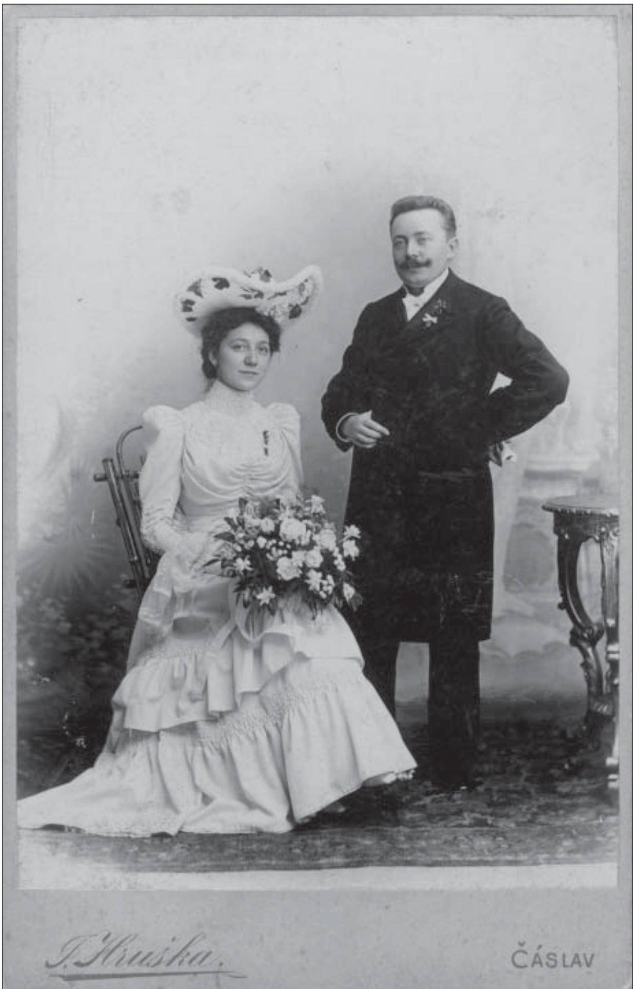
Svatební foto rodičů