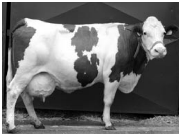
Kráva č. 106448/407 z chovu pana Suchého ve Slavětíně právě ukončila svou pátou laktaci, ve které nadojila 10 291 kg mléka.